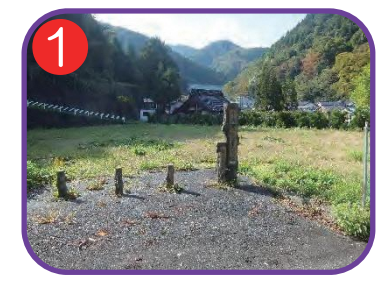
外波地区防災広場 海拔 18.1m