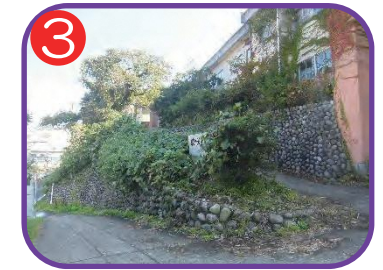
旧歌外波小学校広場 海拔 25.0m