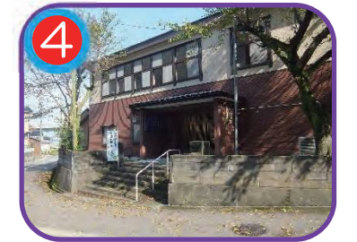
歌外波地区公民館 (指定避難所) 海拔 15.0m