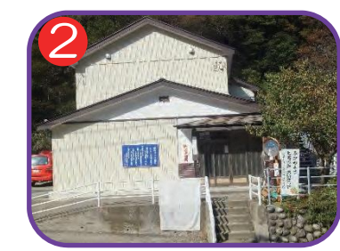
外波支館 海拔 20.0m